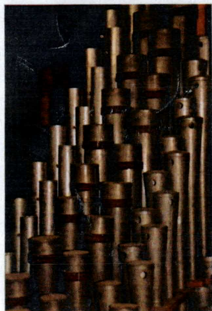
Orgelpfeifen der Friedberger Stadtkirche

Die Königin der Instrumente passt nun mal in kein Wohnzimmer, „das ist schon eine Hürde für den Orgelunterricht“ meint Seeger.